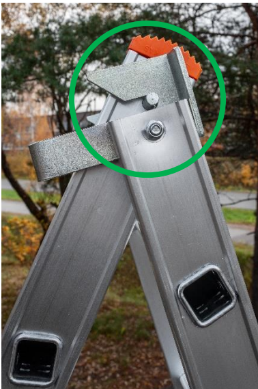
Saranatappi paikallaan hahlossa Tikkaille kiipeäminen turvallista!